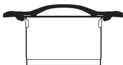
4,0l ø 20 cm